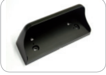
WC_HR50 HR50 sensörü için hava muhafazası